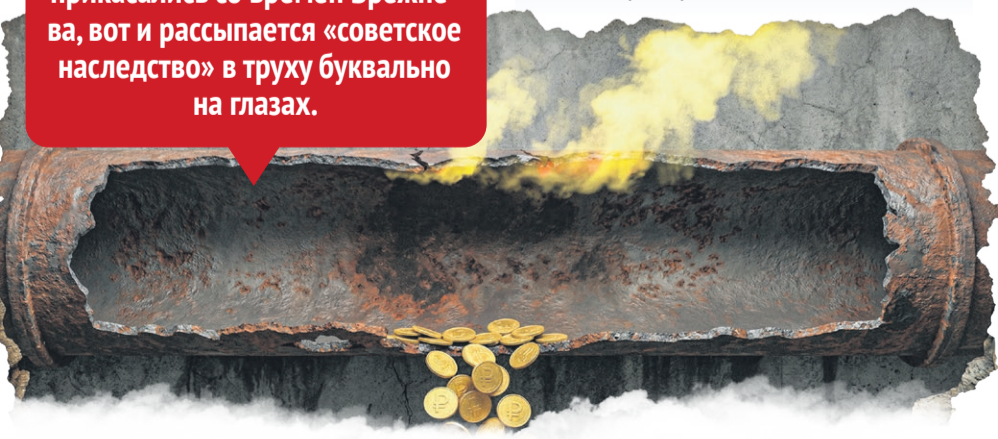
Иллюстрация: Алексей Беленёв

Слишком велики риски, когда экономическая эффективность становится важнее социальной справедливости, а деньги уходят в вороватые руки и не доходят до ремонта труб. Получается нонсенс: власть призывает к модернизации изношенной инфраструктуры, которую построили полвека назад. Люди платят по полной цене, а взамен не получают ни тепла в трубах, ни прозрачности в квитанциях. И пока этот дисбаланс не уберут, социальное напряжение будет только расти с каждым новым отопительным сезоном. Как только появится жесткий контроль – тарифы станут оправданными. Будем этого добиваться!