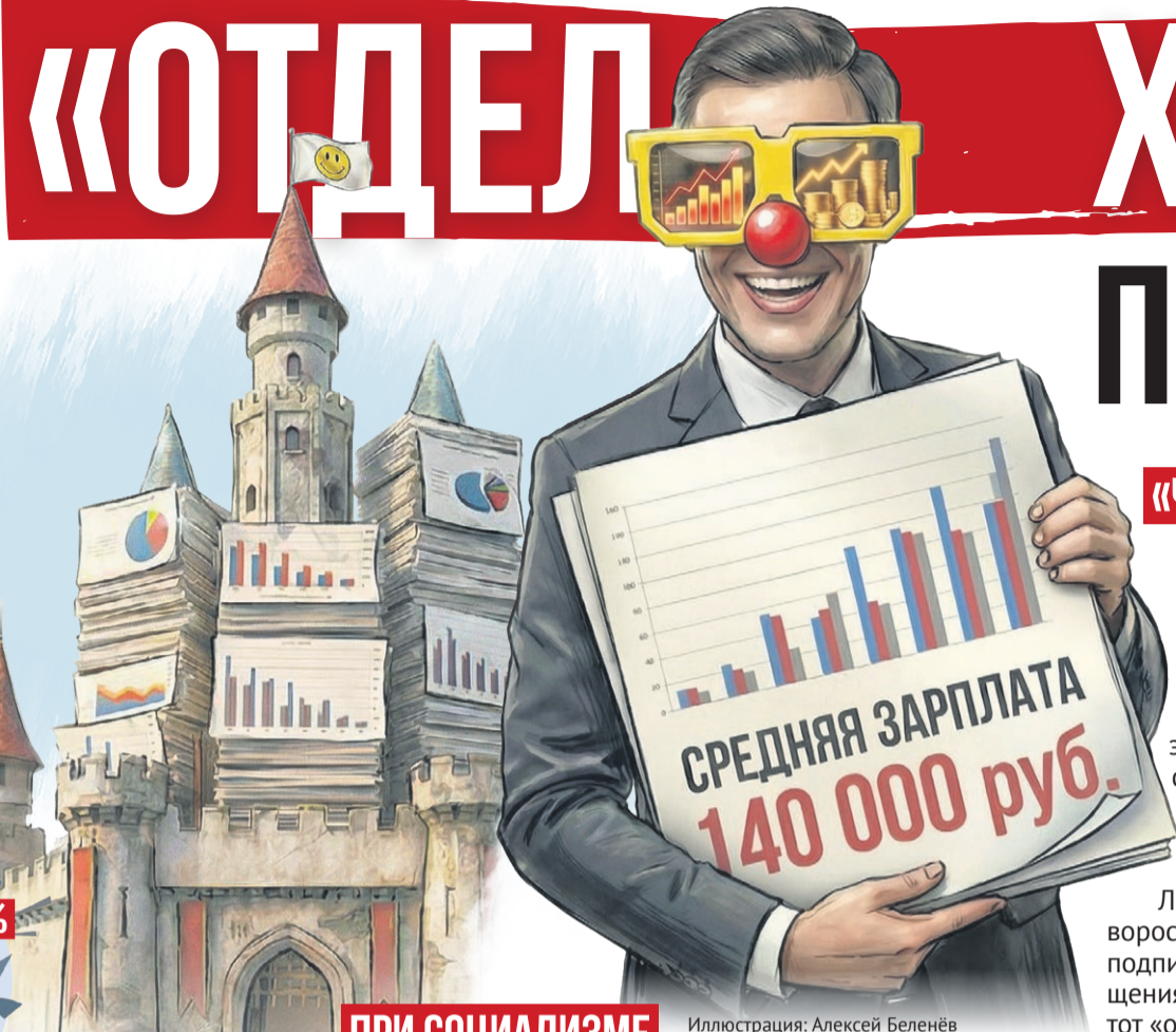
Иллюстрация: Алексей Беленев