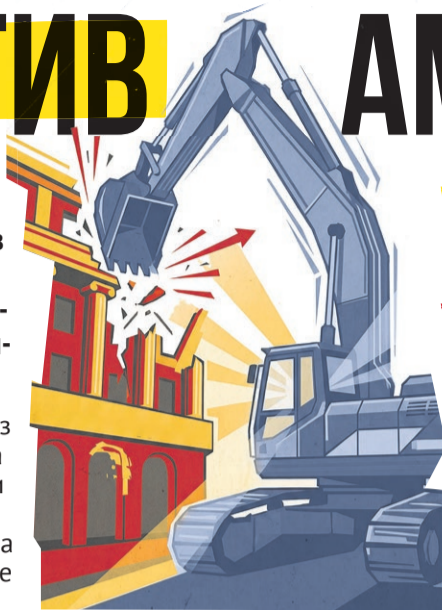
Иллюстрация: Алексей Беленёв