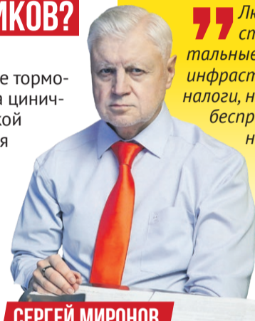
СЕРГЕЙ МИРОНОВ

Оказывается, объединение тормозят местные власти. Причина циничная и прагматичная: городской бюджет «не резиновый»! Для администрации присоединение СНТ – это не просто новые границы на карте, а чудовищная головная боль, потому что придется принять на баланс километры убитых дачных дорог и гнилых коммунальных сетей. Понадобится проводить газ до границ участков и разбираться с жалобами людей.