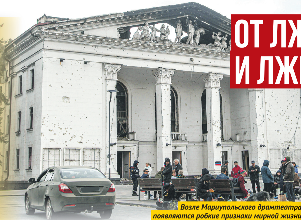
Возле Мариупольского драмтеатра появляются робкие признаки мирной жизни